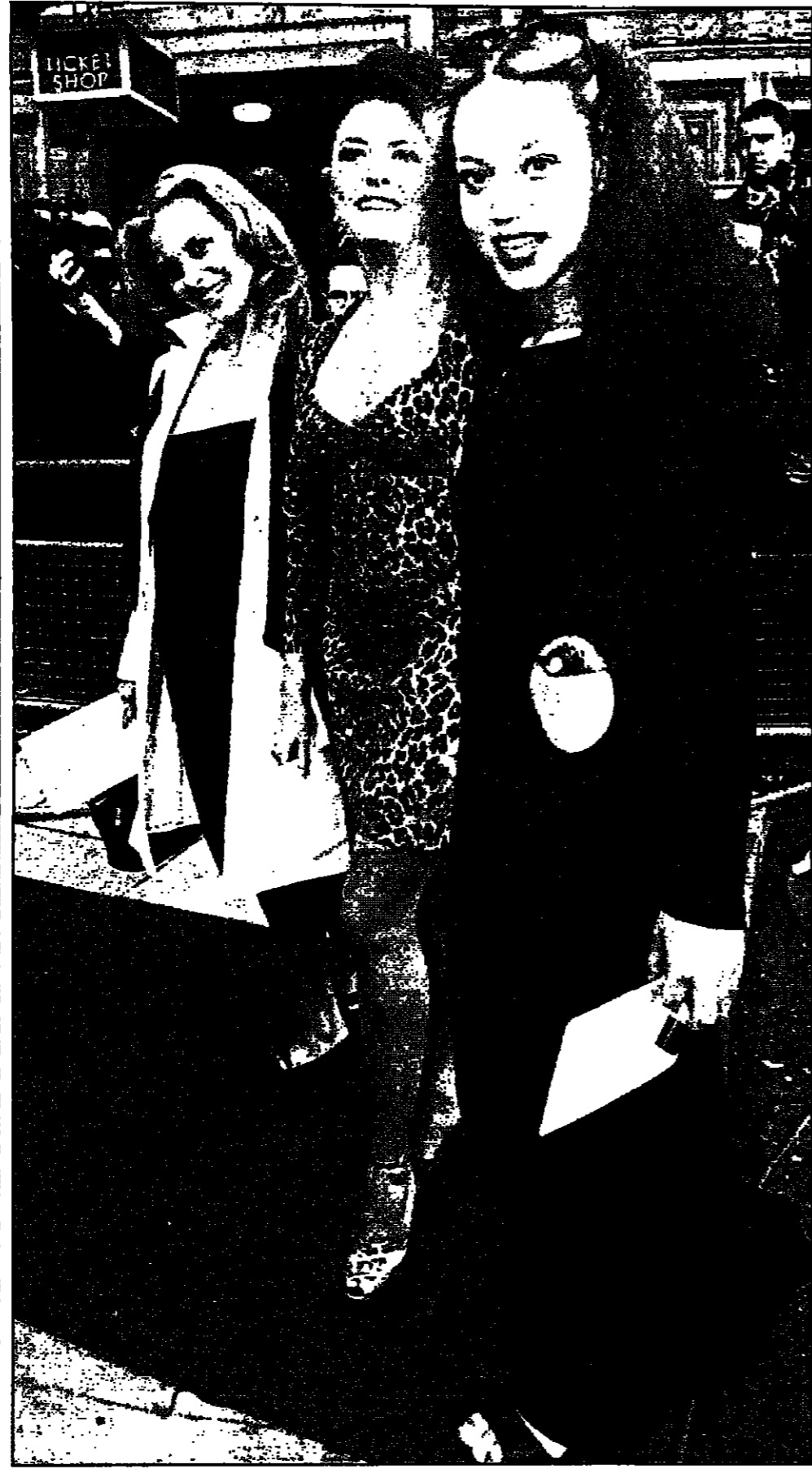
الجيلاتونج (التي البينج) وبيتا توميلي ثم تراسي شارو. نجاحات المسلسل التلفزيوني البريطاني الشهير «كزنيش ستريت» عند وصوله لقاعة رويال هولم هال في لندن أمس الأول لتسلم جائزة «أبطالاً» تقديرية للمسلسل

القاهرة - مكتب القدس العربي: غادرت القاهرة الى باكستان فرقة أم كلثوم للموسيقى العربية بقيادة المايسترو سامي نصير لتقوم بأحيا ثلاث مدن باكستانية هي اسلام اباد ولاهور وكراشي، تقدم فيها عدد من أعمالها الموسيقية خاصة أغنية «حديث الروح».